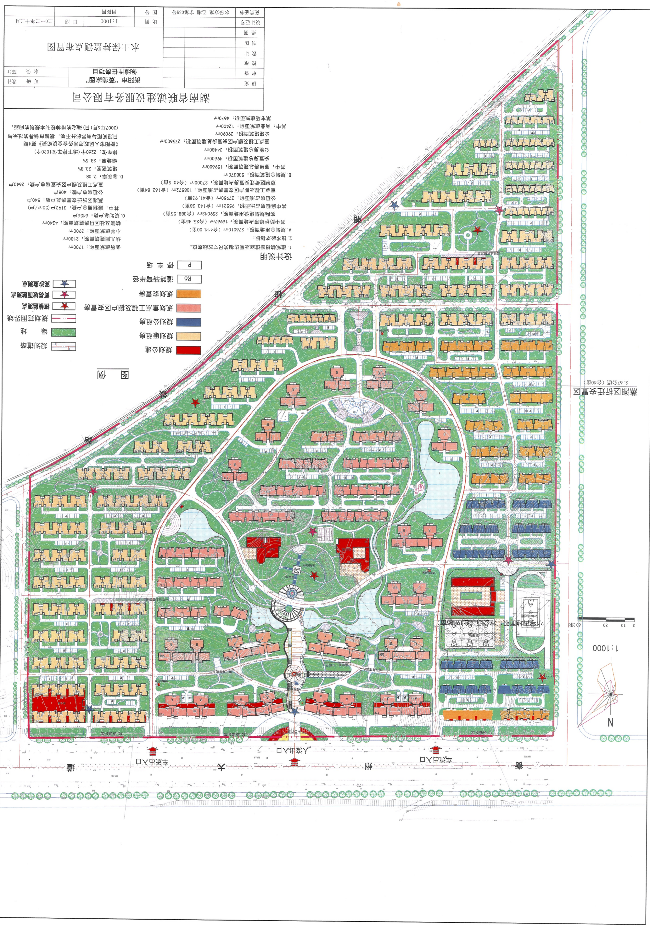
蒸湘区拆迁安置区 2.67公顷(合40亩)